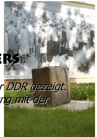
Kofferdenkmal am Notaufnahmelaager

in Marienfelde. Hier wird eine Ausstellung über das Notaufnahmelaager während der Massenflucht aus der DDR gezeigt. Dies ist der nächste Teil in unserer Auseinandersetzung mit der Deutschen Geschichte. Weitere Infos folgen!